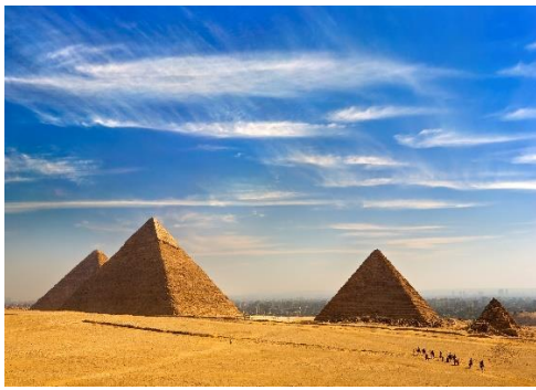
Pirâmides de Giza