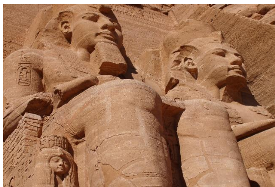
Templo de Ramsés II