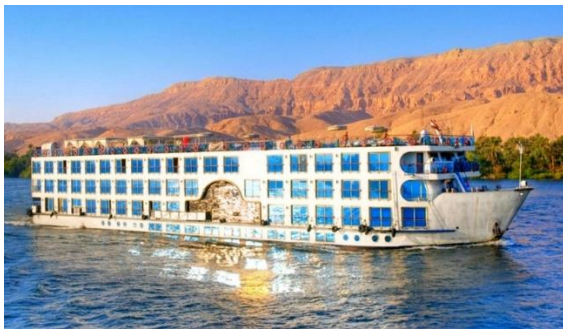
Cruzeiro Nile Dolphin