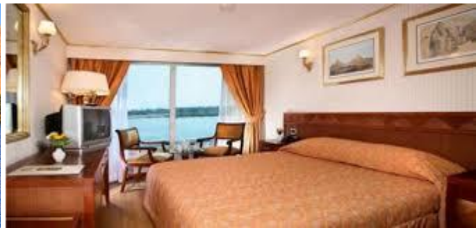
Cabine do Cruzeiro Nile Dolphin