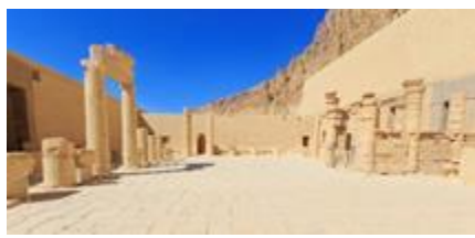
Templo de Hatshepsut

Café da manhã no navio e check out. Saída para visitar o Vale dos Reis, o templo da Rainha Hatshepsut e os colossos de Memnon. Almoço (não incluído) em restaurante local. Após os passeios, transfer para o resort em Hurghada. Jantar e pernoite no resort.